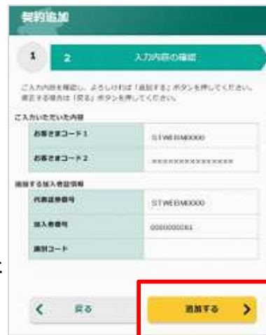
入力内容・追加する加入者情報を確認し追加するをタップ