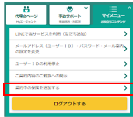
契約中の保険を追加するをタップ