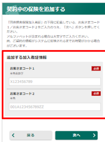
1. でお問合せいただいた「お客様コード」を入力し、次へをタップ