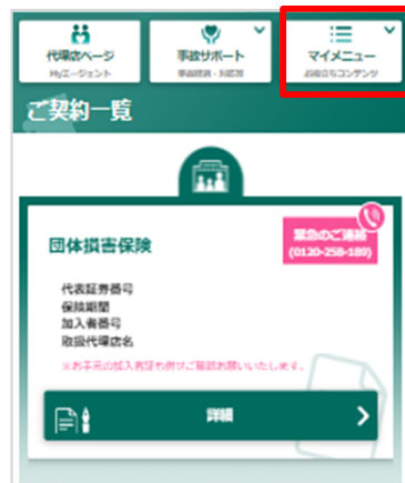
ログイン後、マイメニューをタップ