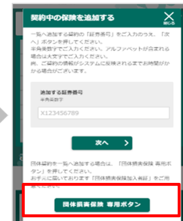
団体損害保険 専用ボタンをタップ