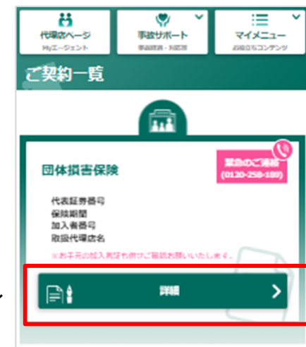
契約追加完了詳細から確認をお願いします